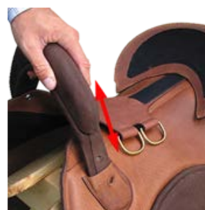
Byte av framvalv